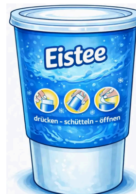
Abb. 3: Ein selbsterkaltendes Getränk. 1