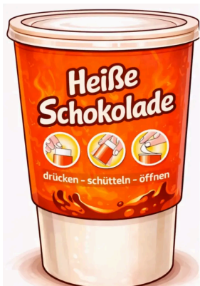
Abb. 1: Ein selbsterhitzendes Getränk. 1