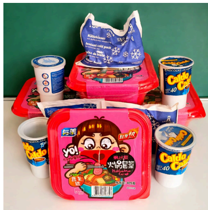
Abb. 2: Hotpots und Kältekissen 2

Heißes Essen ohne Herd, kaltes Getränk auf Knopfdruck – klingt genial. Aber ist das clever gelöst oder nur ein Haufen Verpackung mit kochend heißem Dampf? Entscheide selbst.