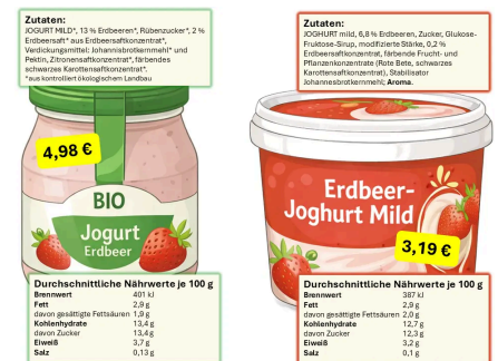
Abb. 3: Joghurt & Joghurt – man kann beides schreiben :-) 3

„Natürliches Erdbeearoma“ klingt gut – aber wie viel Erdbeere steckt wirklich im Becher? Und ist natürlich automatisch besser als künstlich? Mach den Geschmackstest mal mit dem Kopf.