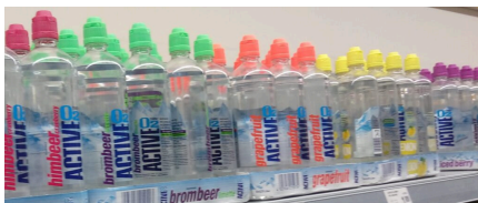
Abb. 1: Mit „Extra-Sauerstoff“ angereicherte Getränke 1

Ein Schluck und du bist fit für den Sport? Manche Getränke werben mit einer Extra-Portion Sauerstoff. Aber steckt da wirklich Power drin – oder am Ende nur warme Luft? Schau genau hin.