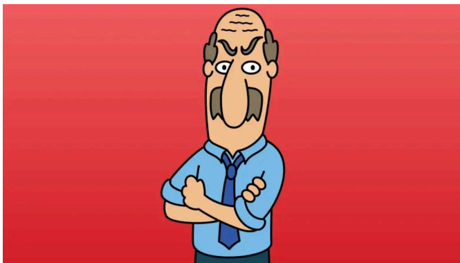
Abb. 1: Der „mürrischer Onkel“

Mit Cranky Uncle kannst du diese Fähigkeit erst mal trainieren, wenn du willst – spielerisch, auf Deutsch, kostenlos im Browser. Zehn Minuten Spielen schärfen den Blick für das, was in M2 von dir erwartet wird.