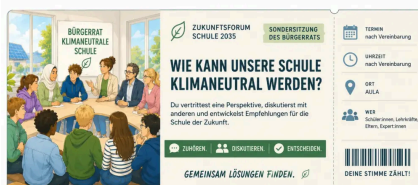
Abb. 2: Dein Ticket.