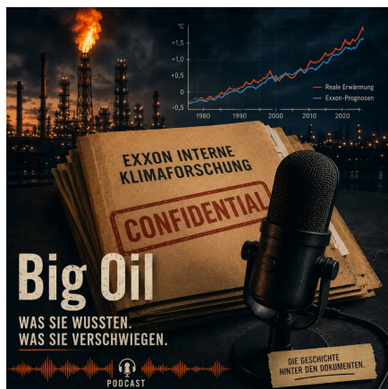
Abb. 1: Die Geschichte dahinter

Große Ölkonzerne wussten seit Jahrzehnten, was ihr Produkt mit dem Klima macht. Und sie nutzen ihr Wissen nicht. Wie funktioniert gezielte Desinformation – und wie erkennst du sie? Mit der PLURV-Methode lernst du, Strategien zu durchschauen, bevor sie dich überzeugen.