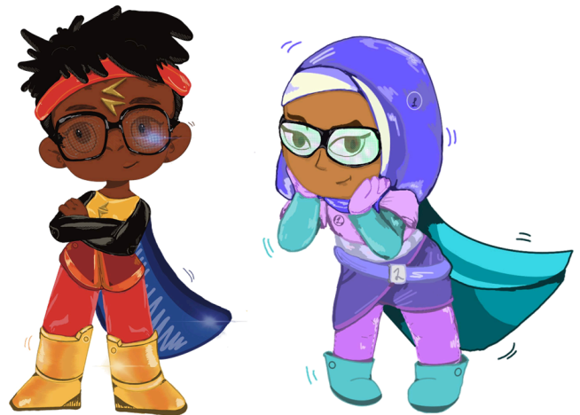
Abb. 2: Superheld und Superheldin mit Super-Brille

Ein Superheld oder eine Superheldin könnten vielleicht hineingucken.