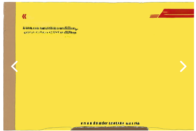
Galerie 1: Was könnte man durch die „Super-Brille“ sehen? 4

Sie ist zu. Und wir dürfen sie nicht aufmachen.