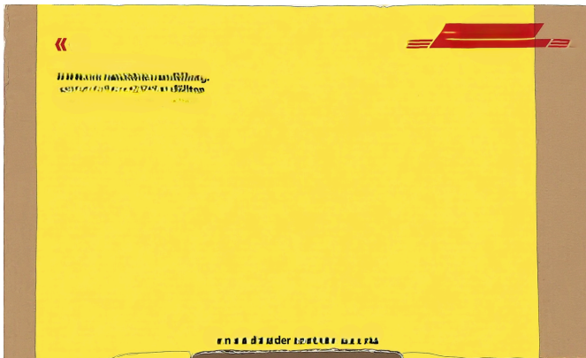
Abb. 1: Eine verschlossene Box. Ein Paket.

Schau mal. Eine Box. Was ist wohl darin?