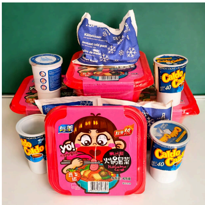
Abb. 1: Sammlung von Hotpots (selbsterhitzender Kaffee und Instant-Ramen) und Kältekissen. 1