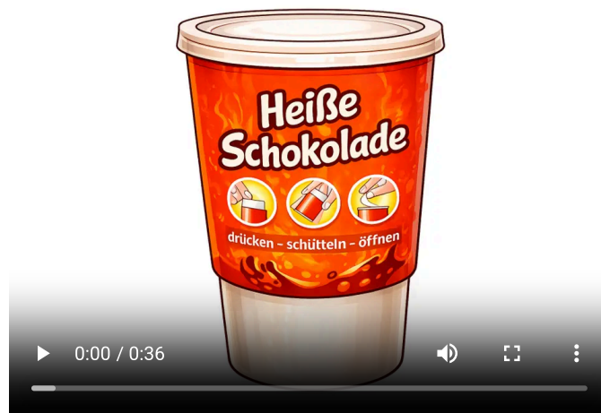
Video 1: Werbung für selbsterhitzenden Kakao und selbstkühlenden Eistee 2

Ob Hotpots oder Kältekissen – allen gemeinsam ist, dass in ihnen Wasser und Salz zusammenkommen, damit sie sich erwärmen oder abkühlen.