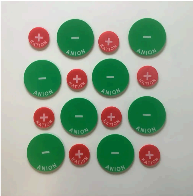
Abb. 3: So könnte das Gitter aussehen 1

Du kannst von Karlottenmodell auf Kugel-Stab umstellen, dann kannst du „hinein sehen“.