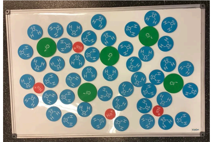
Abb. 2: Teilchen-Modelle auf einem Whiteboard 1

Lass uns das Verdunsten auf der Teilchenebene nachstellen und dabei modellhaft erklären, wie ein Kristall entsteht.